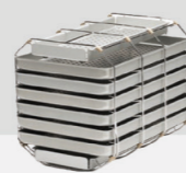
Halterung E Plus für 6 Standard-Tabletts und 2 schmale Tabletts