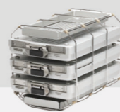
Halterung F Plus für 3 MELAstore® Box 100 und 2 schmale Tabletts